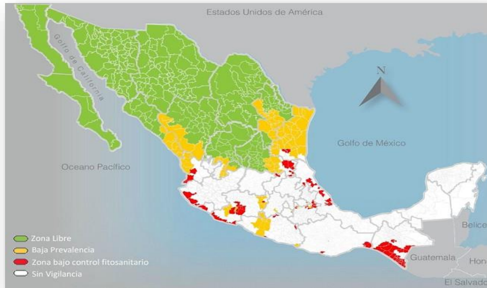
Situación fitosanitaria actual DGSV

Los índices MTD son: para A. ludens 0.0000 A. obliqua 0.0005, A. striata que es de 0.0093 y A. serpentina 0.0000 por debajo de la categoría de Zona de Baja Prevalencia.