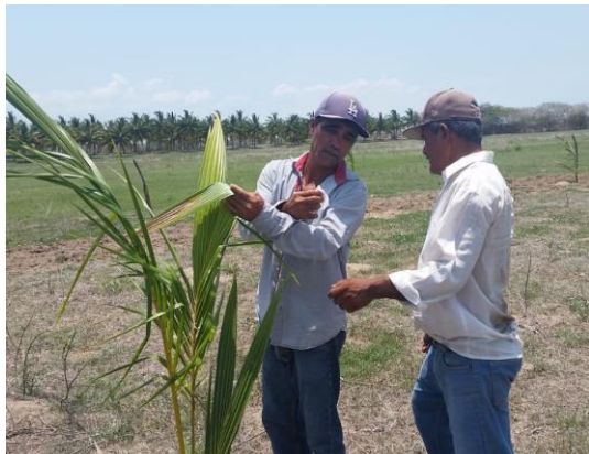
Fig. 1. Entrenamiento a productores.

En el mes de agosto de 2018 el acaro rojo de las palmas se encuentra bajo control fitosanitario en los municipios de Bahía de Banderas, Compostela, Tepic, San Blas y Santiago Ixcuintla. Los municipios de Rosamorada y Tecuala se reporta libres de esta plaga cuarentenaria. La superficie afectada en el estado de Nayarit al mes de agosto es de 513.5 hectáreas de cocotero y palmas ornamentales con un promedio de 3.0 ácaros/cm 2 en las hojas infestadas.