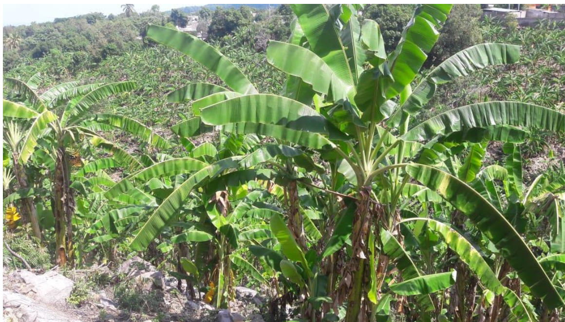
Fig. 3. Plantación de Plátano, variedad Pera, municipio de San Blas.

Con la implementación de la campaña contra moko del plátano el estado de Nayarit y las acciones oportunas de control y erradicación realizadas durante en años anteriores, y la aplicación de medidas preventivas para evitar la reinfestacion de las zonas plataneras, el porcentaje de infestación al mes de septiembre de 2018 en el estado de Nayarit es nulo (0.00), por lo que se está cumpliendo el objetivo planteado de mantener al estado de Nayarit sin presencia de la enfermedad bacteriana moko del plátano ( Ralstonia solanacearum raza 2) en 2,844.60 hectáreas, para obtener la declaratoria de zona libre de Moko del plátano al estado de Nayarit.